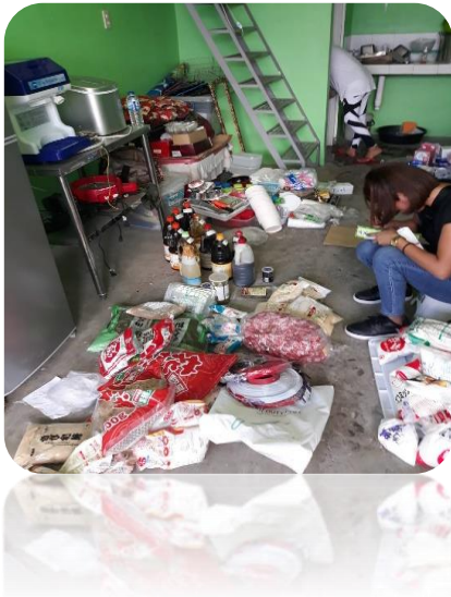
店内の様子、、、コレ、ホントに片付くの？