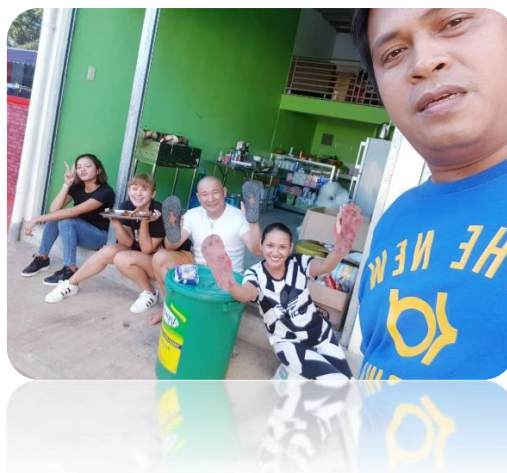
片付け終わり、ホッと一息～♪ 店舗の前でみんなと記念撮影